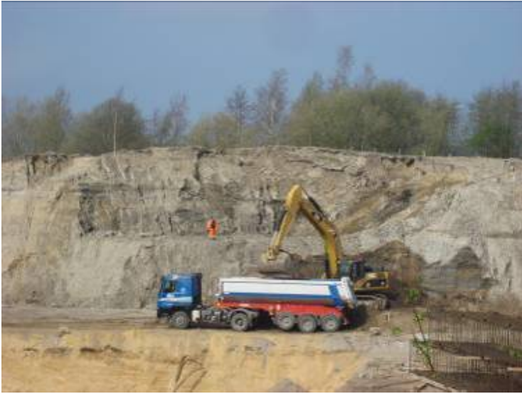
XFEL-ի ուղու արտափորման աշխատանքների սկիզբը, մուտքը DESY-ից, իսկ վերջը կլինի 3 կմ հեռու՝ Շլետիգ-Հոլսթախիում: Ուղին կձգվի 35 մ. մակերևույթի տակ, կառուցումը պլանավորված է ավարտել 2012թ-ին, արագացուցչային սեկցիաները ևս պլանավորված է ավարտին հասցնել մինչ այդ ժամանակահատվածը