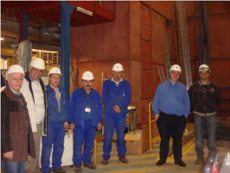
ԵրՖի տեխնիկների խումբը և DESY անձնակազմը HERA արագացուցչի վրա անցկացվող HERA-B գիտափորձի ստորգետնյա սենյակում: Մեկ ամսվա ընթացքում ԵրՖի աշխատակիցները օգնում էին DESY-ում դեմոնտաժել արդեն ավարտված գիտափորձը: Նրանց աշխատանքը բարձր գնահատվեց DESY-ի ղեկավարության կողմից: Ավարտված գիտափորձի որոշ էլեկտրոնային մասեր պահվեցին հետագայում Երևան տեղափոխելու նպատակով: Էլեկտրոնիկան կօգտագործվի ԵրՖի-ում նորաստեղծ Տիեզերական Կրթական Կենտրոնում դասընթացներ կազմակերպելու համար ԵՊՀ-ի ուսանողների համար