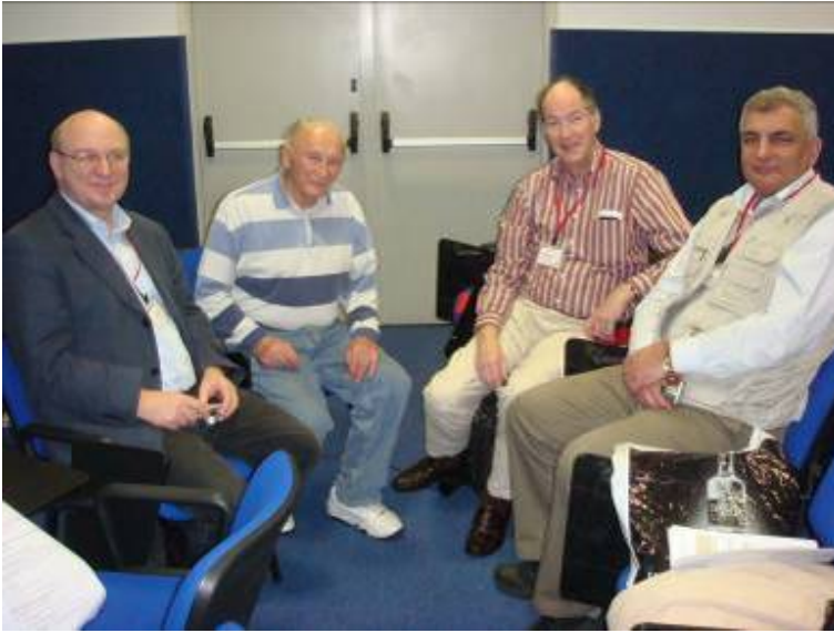
INTAS համագործակցություն, ձախից աջ. Պրոֆեսոր Դոկտոր Ռաիներ Հիփլեր, Գրայսֆալդի համալսարանի Ֆիզիկայի ինստիտուտ, Պրոֆեսոր Լեվ Դորման, Տել- Ավիվի համալսարան, Տեխնիոն և Բարայելի Տիեզերքի Գործակալություն, Պրոֆեսոր Էովին Օ. Ֆյուկիգեր, Բեռնի Համալսարանի Ֆիզիկայի ինստիտուտ, Պրոֆեսոր Աշոտ Չիլինգարյան, Երևանի Ֆիզիկայի ինստիտուտ

INTAS համագործակցության N 06-100017-8777 հանդիպումը “Արեգակնային և գալակտիկական տիեզերական ճառագայթների արագացումը և մոդուլյացիան” անվանմամբ անցկացվեց Իտալիայում COST Action-ի բոլոր հիմնական հետազոտողների մասնակցության շնորհիվ: