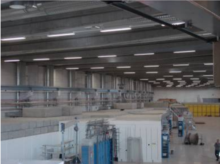
Նորակառույց փորձարարական սենյակը PETRA 3 կուտակող օղակում՝ ապահովելու համար ինտենսիվ ռենտգենային ճառագայթների 14 փնջեր դրանց կոնդենսացված նյութերի ուռումնասիրությունից մինչև բժշկագիտական կիրառություն տալու համար: Հունվարի 21-ին 14 օնդուլատոր մագնիսներից մեկը, որը PETRA 3-ի համար պետք է ստեղծի ինտենսիվ ռենտգենային լույս, տեղադրվեց 300 մ. երկարությամբ փորձագիտական սենյակում: