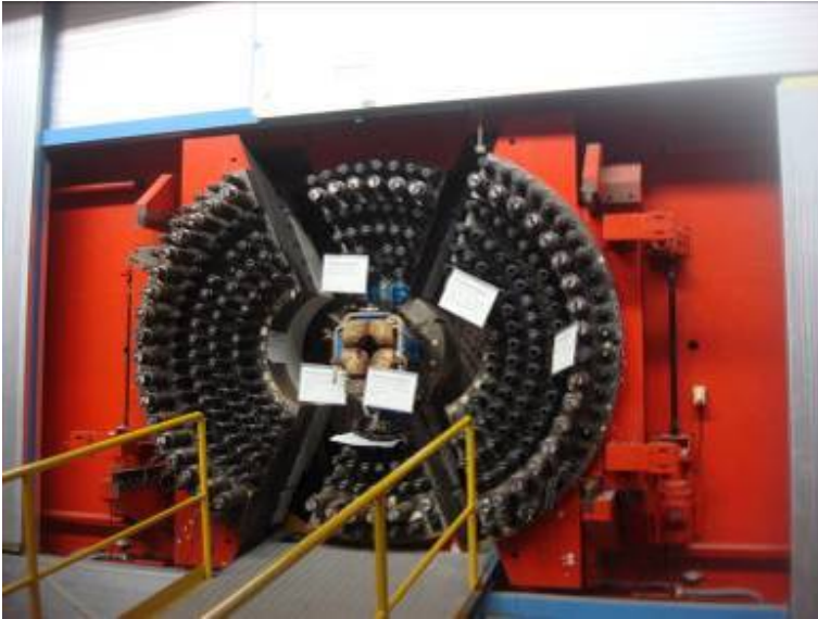
ARGUS սպեկտրոմետրը DORIS կուտակող օղակներում, կփոխարինվի OLYMPYS դետեկտորով Մասաչուսեթսի Տեխնոլոգիայի Ինստիտուտի կողմից